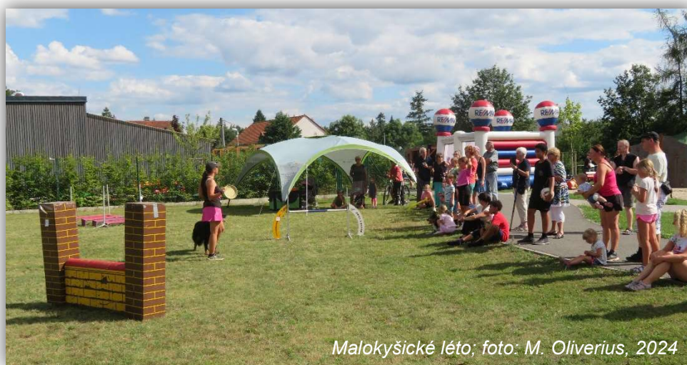
Malokyšické léto; foto: M. Oliverius, 2024

Malokyšické OZVĚNY, zpravodaj obce Malé Kyšice, okres Kladno Vydává: min. 4x ročně obec Malé Kyšice, IČO 00640557, prostřednictvím redakční rady, ev. číslo MK ČR E17465. Toto číslo v nákladu 230 výtisků bylo vydáno v Malých Kyšicích dne 11. 9. 2024. Neprodejné. Kontaktní adresa: Obecní úřad, Malé Kyšice, ul. Míru 72, 273 51 Unhošť. ou.malkysice@volny.cz, www.malekysice.cz