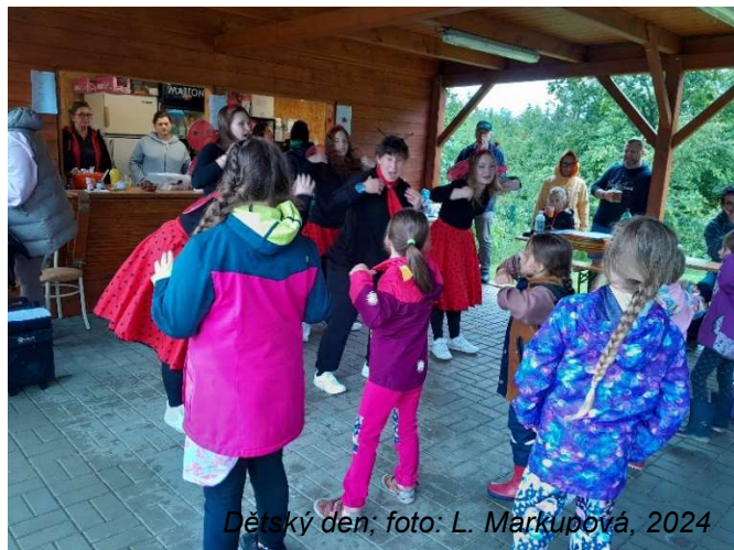
Dětský den; foto: L. Markůpová, 2024

Zastupitelé obce Malé Kyšice děkují spolkům Taneční a sportovní centrum Moon a UNHfree.net za spolupráci při konání dětského dne v sobotu 1. června 2024.