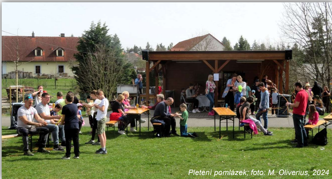
Pletení pomlázek; foto: M. Oliverius, 2024