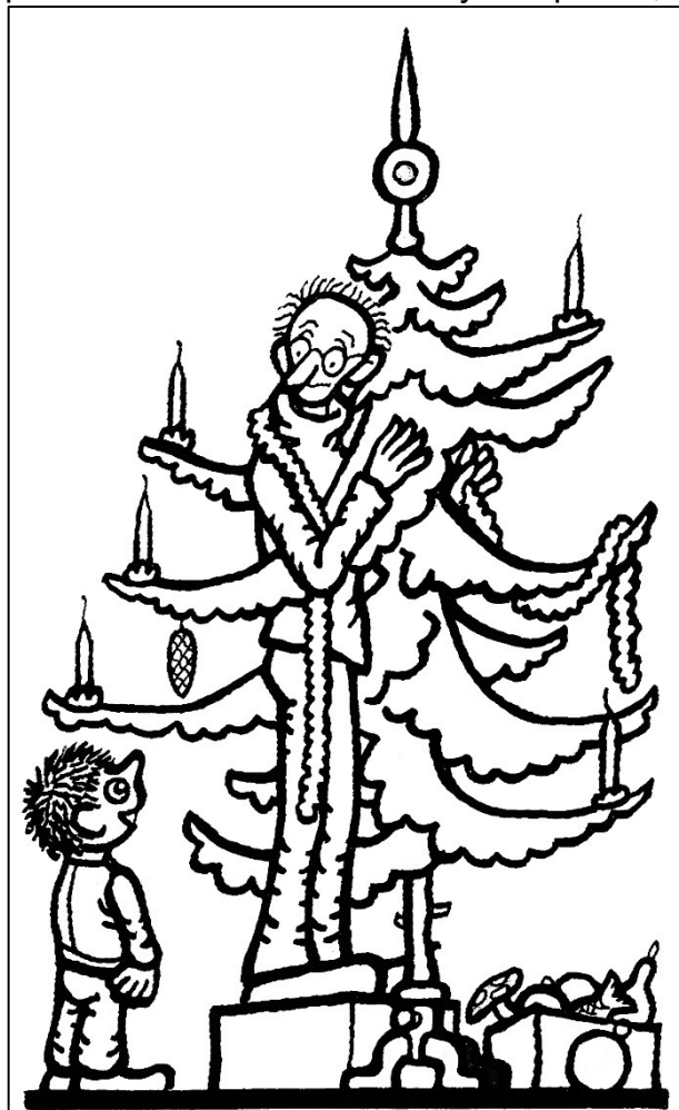
Mám v tom praxi, Pepičku: celej rok strojím maminku.

Od roku 2003 spolupracuji s nakladatelstvím Epoque, kde jako externí redaktor zpracovávám Mistrův archiv pro knižní vydání. S Epochou jsem vydal 29 titulů s Nepraktovými kresbami, s jinými knižními domy další 4 knihy. Zároveň spolupracuji na pořádání výstav, na vydávání pohlednic, reedici stolních her se značkou Neprakta, vybírám kresby pro obaly audioknih s povídkami M. Švandrlíka – zkrátka podílím se na celkové popularizaci Winterova díla. Časem jsem se stal i životopiscem obou tvůrců, původních zakladatelů „firmy“ Neprakta, tj. Bedřicha Kopeckého a Jiřího Wintera.