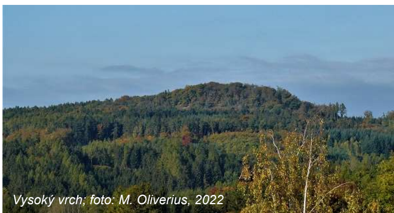
Vysoký vrch; foto: M. Oliverius, 2022

V závěru volebního období také čtyři obce z jihozápadní části kladenského okresu – Běleč, Bratronice, Horní Bezděkov a Malé Kyšice – byly vyzvány k seznámení se se záměrem na vyhlášení Národního parku Křivoklátsko . V současné době je jim tento záměr předložen Ministerstvem