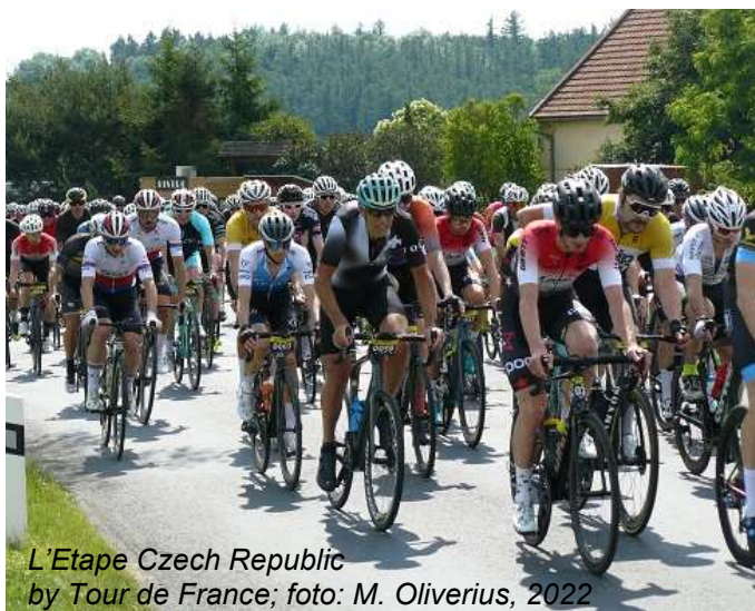
L'Etape Czech Republic by Tour de France

Řidiči si začátkem měsíce června t. r. zajisté všimli upozornění ohledně krátkodobého uzavření komunikace Unhošť – Horní Bezděkov. V sobotu 11. června se i Unhošťskem přehnal peleton (o síle 2 240 závodníků) amatérského cyklistického závodu L'Etape Czech Republic by Tour de France . Závodníci startovali z pražského Strahova, kde po ujetí 136 km (nebo po zdolání kratší trasy necelých 92 km) byl i cíl. Nejbližší místo od nás, kam jsme je mohli přijít povzbudit, byla křižovatka „na Americe“ (viz foto). Závodníci projeli Unhoští,