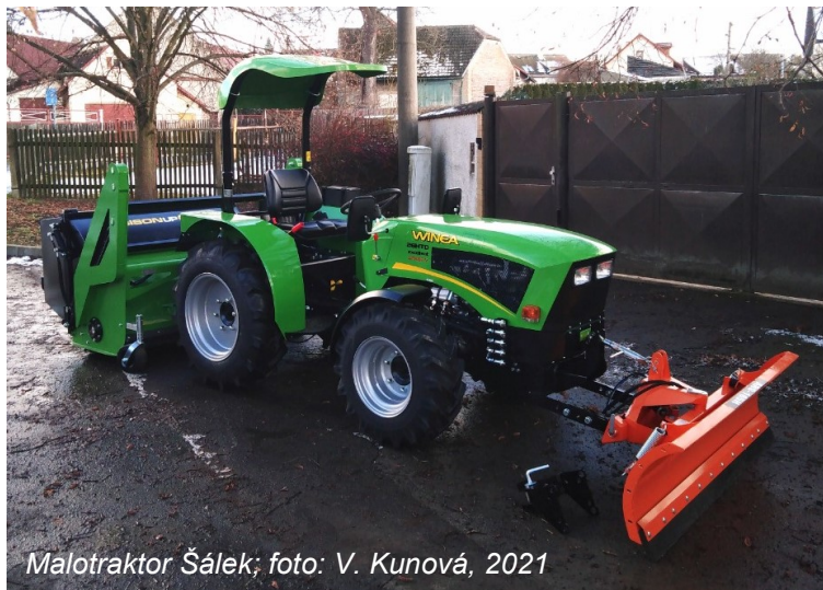
Malotraktor Šálek; foto: V. Kunová, 2021

Vracíme se k vydatné sněhové nadílce, která byla letos příjemným zpestřením pro všechny děti, obzvláště pro ty, které již několik měsíců