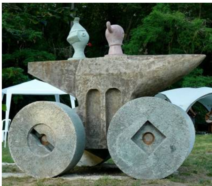
Pocta kovářům a mlynářům