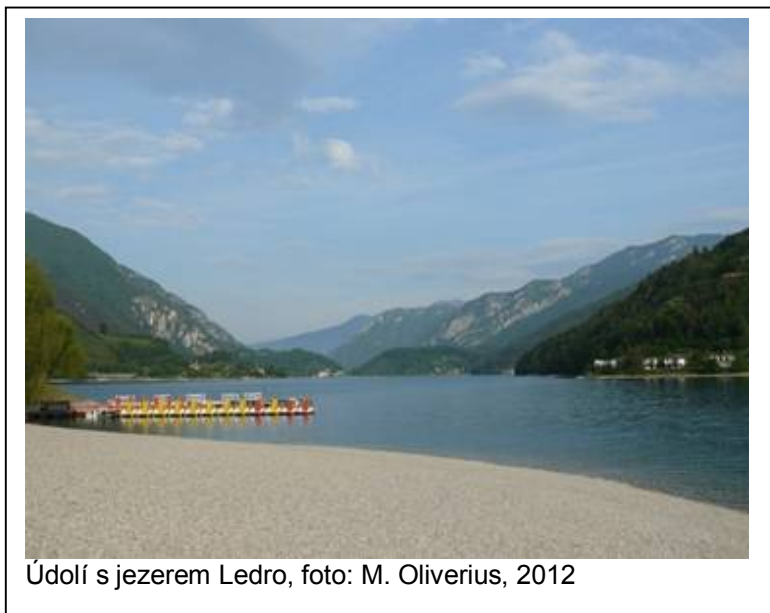
Údolí s jezerem Ledro, foto: M. Oliverius, 2012

Od uváděné doby uplynulo sto let. V tehdy válečnou mašinérií postiženému Tridentsku (včetně údolí jezera Ledro) se všechno změnilo. Dnes se jedná o bohatý,