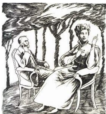
ALFRED NOBEL • BERTHA VON SUTTNER

Sdělovací prostředky v posledních dnech přinesly zprávy o letošním udílení Nobelovy ceny za mír, na kterou bylo nominováno rekordních 259 kandidátů (209 z řad jednotlivců a 50 organizací). Ví se, že mezi uchazeči je například pakistánská šolačka Malalaj Júsufozáiová, která neohroženě bojuje za právo dívek na vzdělání, bývalý americký prezident Bill Clinton, či reformám nakloněný barmský prezident Thein Sein. Z jakého důvodu to vše připomínám v místním periodiku?