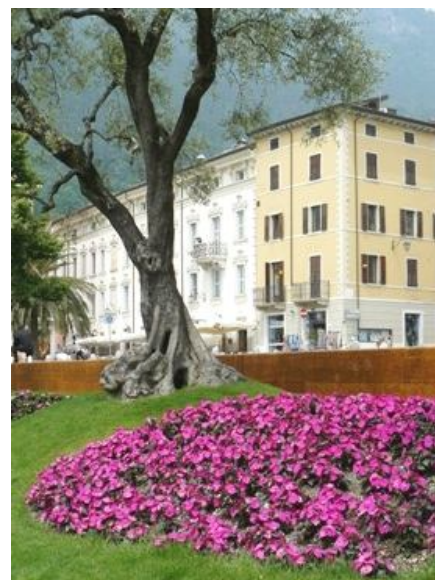
Riva del Garda, Itálie