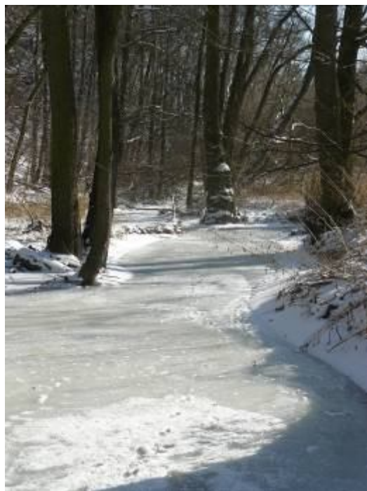
Únor na Kačáku

Když si ten stav zpětně vyhodnotíme, tak nic nového pod sluncem. Pamatujete, převážně vy, dříve narození? V dobách našeho mládí v lednu, v únoru, ale někdy i v březnu častokrát mrzlo až praštělo. Ve školách se neučilo, přimrzlé uhlí nešlo skládat z vagónů, nebylo čím topit, a proto k radosti dětí bývaly „uhelné“ prázdniny. Bylo tehdy po málu zimních stadionů, za to na každém vesnickém rybníku místní hokejová mužstva hrála své mistrovské zápasy, a pokud se nehrál hokej, tak kluci a holky tam bruslili od rána do večera.