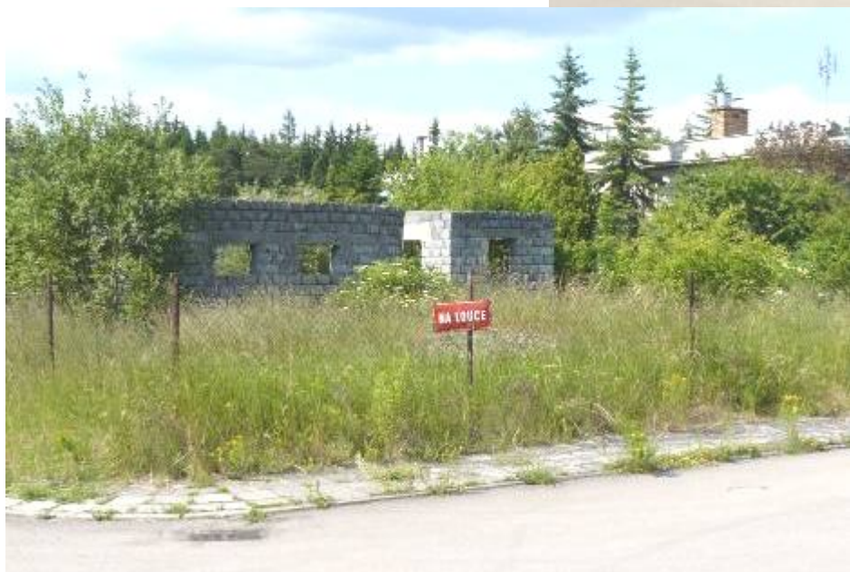
Na rozhraní malokyšických ulic „Za Mlýnem“ a „Na Louce“. (Fotografie z 22. 6. 2010)