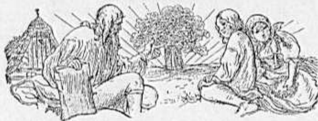
M. Aleš: Vyprávění z kroniky.

Šťastná obec měla-li v minulosti (a má-li i v současnosti) někoho, tedy svého kronikáře, kdo dokáže i v malé obci podchytit alespoň základní události dotýkající se, ať už pozitivně nebo negativně, života místních obyvatel. Aby tomu tak skutečně bylo i v této „naší“ době, v době, kterou t.č. prožívají dnešní generace, tak